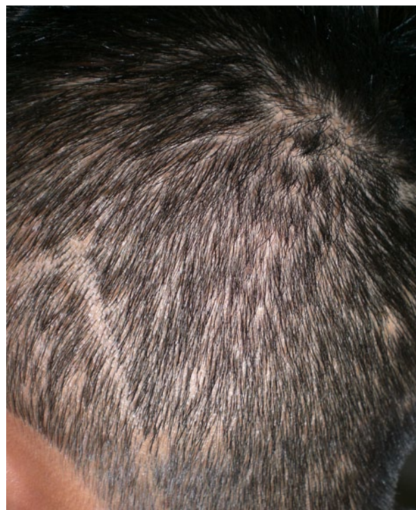
Figura 2. Alopecia difusa con patrón apolillado. Zona temporo-occipital izquierda.